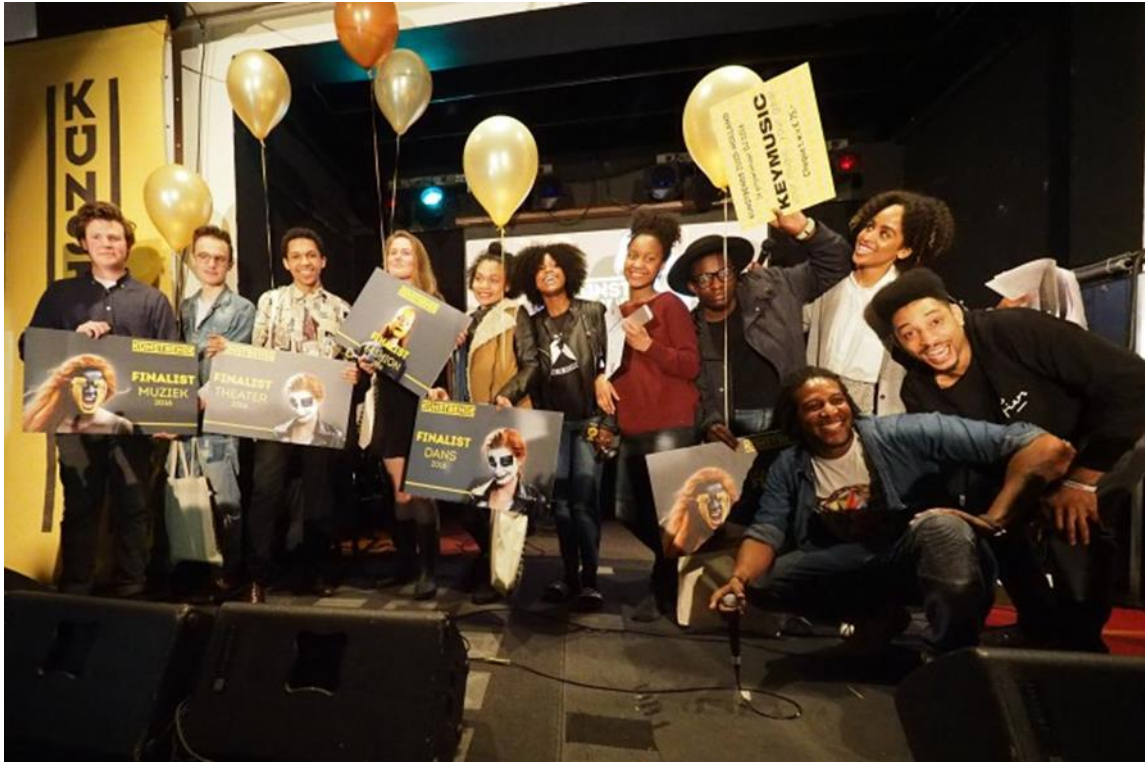
foto: halve finale Kunstbende Zuidholland, mei 2016 in het HPC